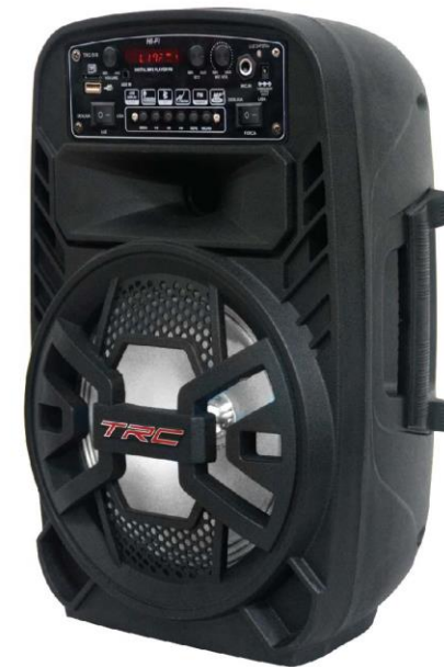
Imagem meramente ilustrativa Leia atentamente este manual antes de ligar o aparelho